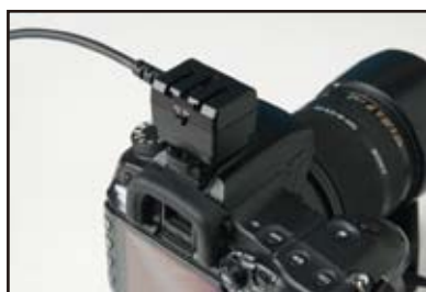
カメラ取付け写真