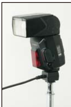
ストロボをエクステンションシュー取付け時