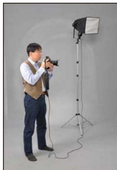
当社発売スピードライトボックスを使用した例 (カメラ、ボックス等は含まれておりません)