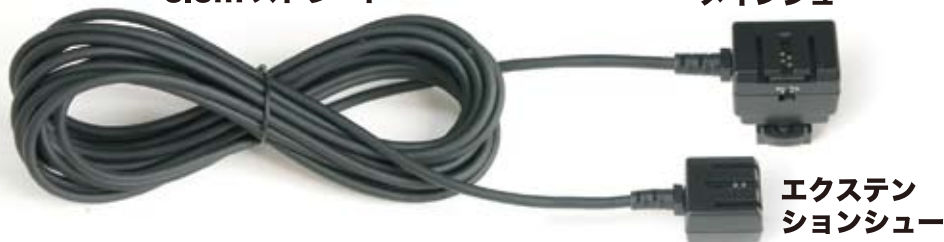
エクステンションシュー