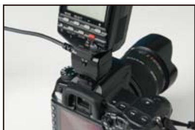
ストロボをカメラ上部取付け時